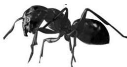
Thiamethoxam 0,01% Gel Cebo Gel Hormigas