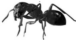
Thiamethoxam 0,01% Gel Cebo Gel Hormigas